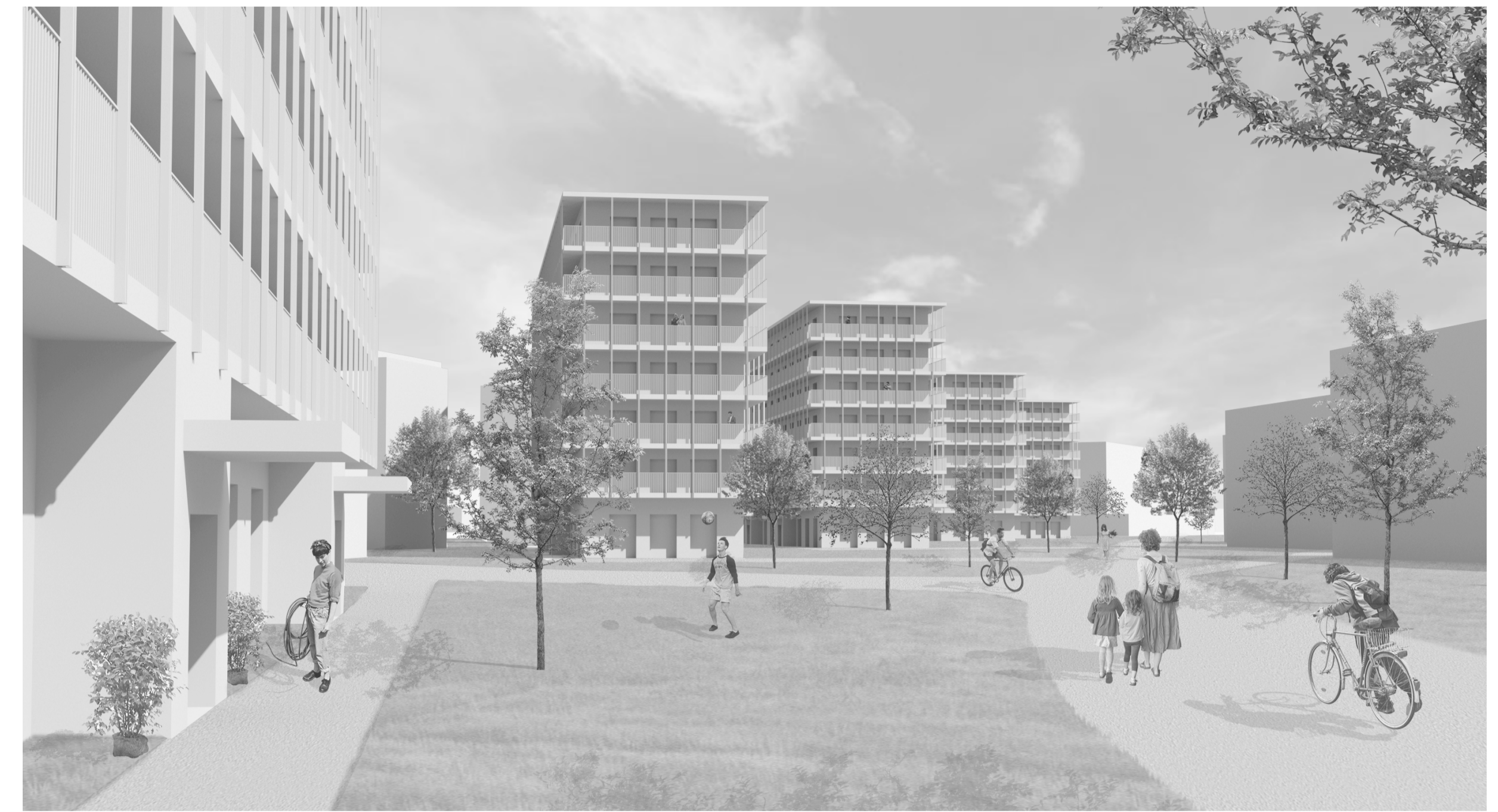
P1. Perspektiv av det gröna stråket.