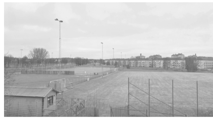
Vy över planområdet.

Platsen består idag av en öppen grönyta med fotbollsplaner, klubbhus och förskola och i norra delen ligger hållplats Ekestrådgatan med stora flöden av busstrafik. Hjalmar Brantingsgatan är tungt trafikerat med höga bullernivåer och blir en barriär som förhindrar rörelse till intilliggande områden. Sotérusgatan har betydligt lägre flöden och upplevs överdimensionerad, samt att den ligger parallellt med Ekestrådgatan och fungerar därför mest som en genväg till villaområdena söder om området. Då Sotérusgatan ligger i kontakt med den öppna grönytan så upplever man som fotgängare en avsaknad av rumsligheter och blickfångande motiv.