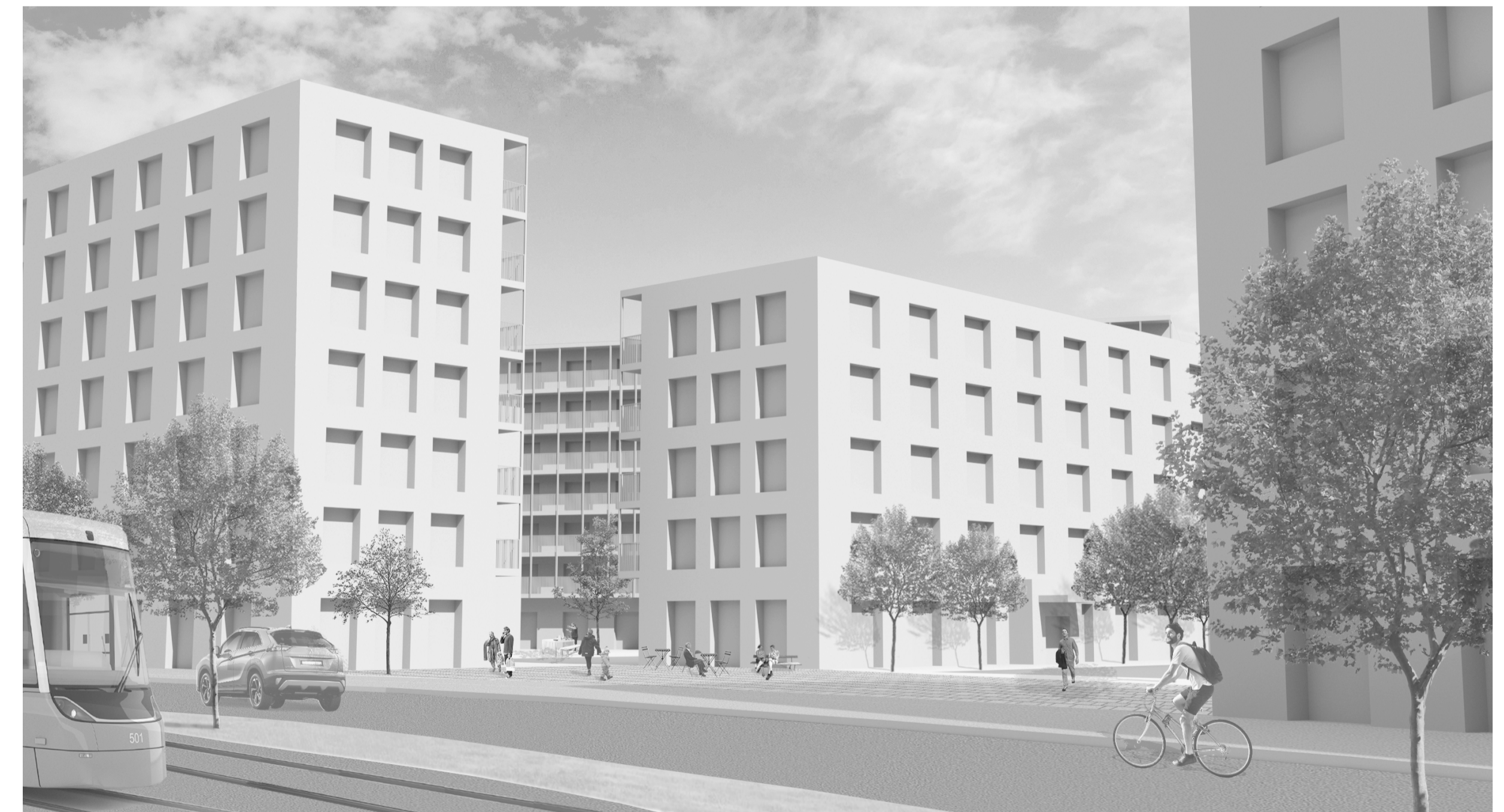
P2. Perspektiv av platsbildning längs boulevarden.