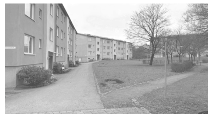
Befintlig bebyggelse och gård.

Den intilliggande befintliga bebyggelsen består av villaområden, samt lamellhus och punkthus främst från 1950-talet. Byggnaderna är fristående, men placerade på ett sätt så de blir rumsskapande och bildar trevliga gårdar och publika grönytor.