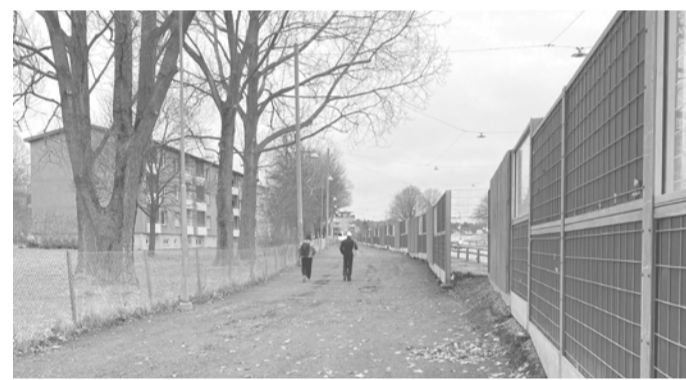
Stråk intill Hjalmar Brantingsgatan.

Den intilliggande befintliga bebyggelsen består av villaområden, samt lamellhus och punkthus främst från 1950-talet. Byggnaderna är fristående, men placerade på ett sätt så de blir rumsskapande och bildar trevliga gårdar och publika grönytor.